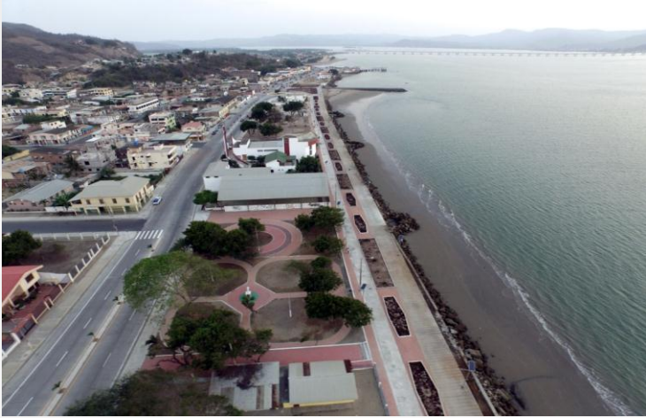
MALECON DE SAN VICENTE