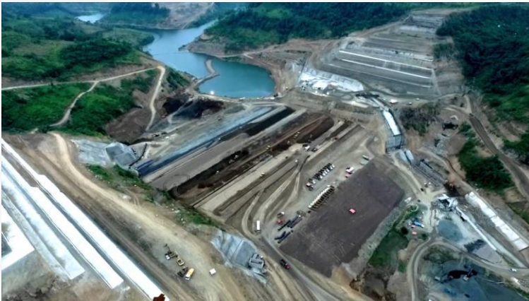
PROPOSITO MULTIPLE CHONE