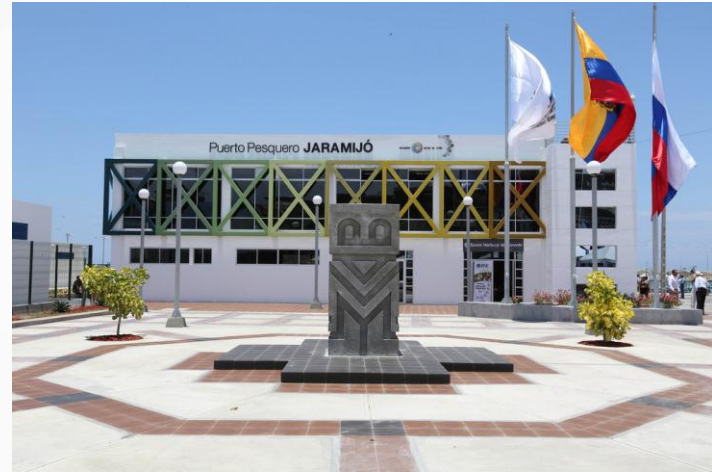
FACILIDAD PESQUERA JARAMIJO